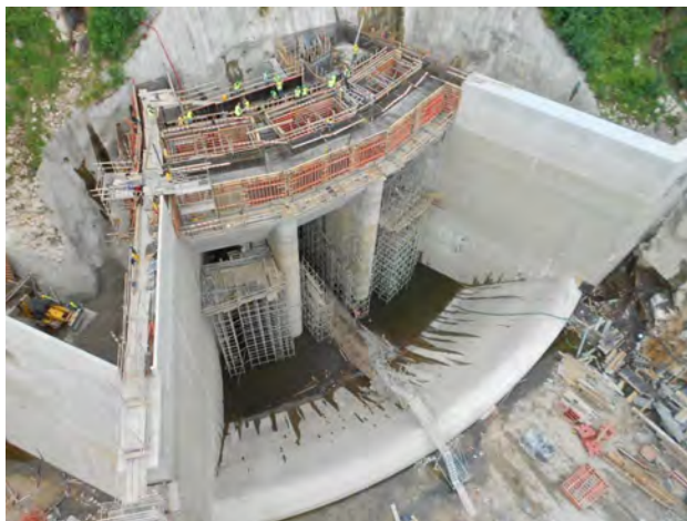
Trabalhos na zona Restituição Albufeira da Caniçada

A central está equipada com um grupo gerador reversível com uma potência nominal de 207 MW.