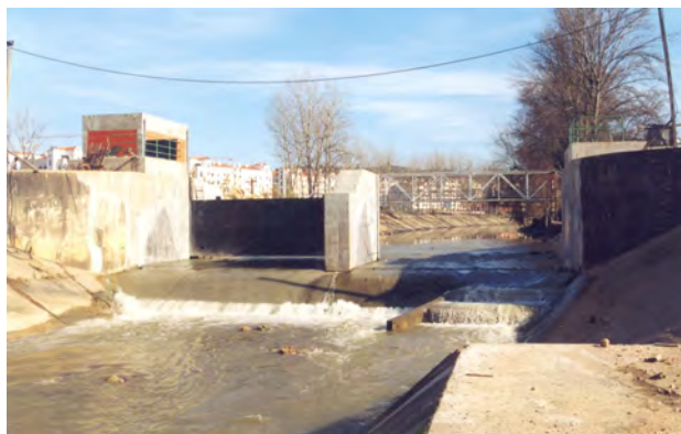
Açude do Arrabalde: vista de jusante dos dois vãos, ensecadeira e casa do comando eléctrico

A execução do novo açude, compreendeu a construção de dois encontros laterais, um pilar central e ainda de dois poços, um em cada margem, que albergam os servo-motores que accionam as comportas. A obra contemplou ainda a automatização das duas tomadas de água para rega.