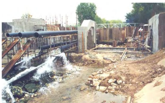
Açude do Arrabalde: rio a escoar apenas nos tubos inferiores, durante a execução da obra