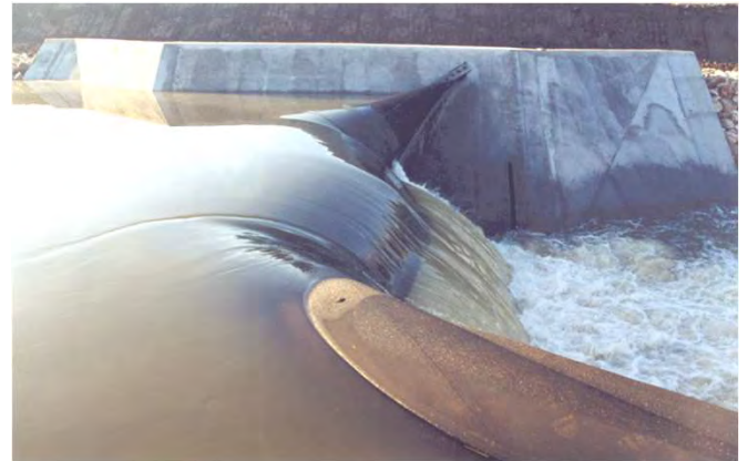
Açude das Salgadas em plena carga (pormenor do insuflável)