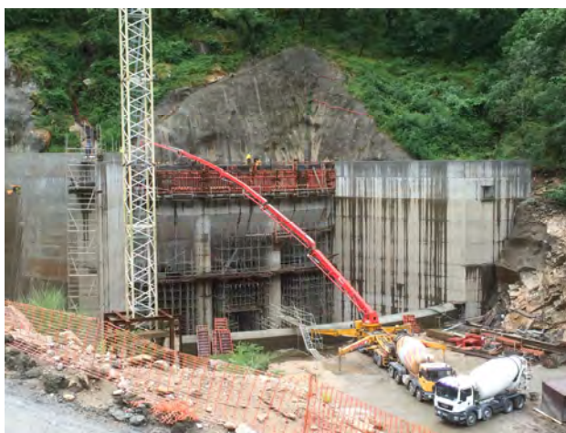
Trabalhos na zona Restituição Albufeira da Caniçada