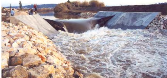
Açude das Salgadas: vista de jusante da margem direita (açude a descarregar com o insuflável a esvaziar)

A obra consistiu numa "barragem insuflável" que, em termos gerais, é constituída por uma soleira em betão fundada em oito estacas com 60 cm de diâmetro e profundidades entre 18 e 24 metros, na qual foi encastrada uma câmara de borracha sintética reforçada. A reabilitação contemplou ainda a automatização da tomada de água para rega.