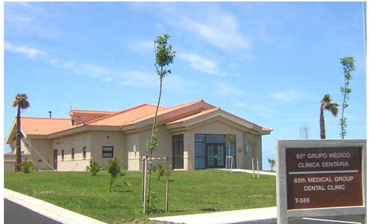
Aspecto do exterior do edifício Outside view of the Dental Clinic

Fez também parte da empreitada o fornecimento e instalação de todo o sistema de ar condicionado, ar comprimido, vacuum, oxigénio, esterilizador, som e detecção de incêndios, bem como todo o mobiliário dos consultórios, laboratório e sala de raio X.