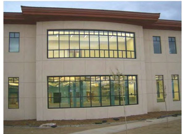
Aspecto do exterior do edifício Outside view of the Fitness Center

Beside the “normal” specialties as water, drain, electrical e communications, was included in our scope of work the supply and installation of a hydraulic elevator, all the systems as: air conditioning, music, commercial intrusion detection system and fire alarm system.