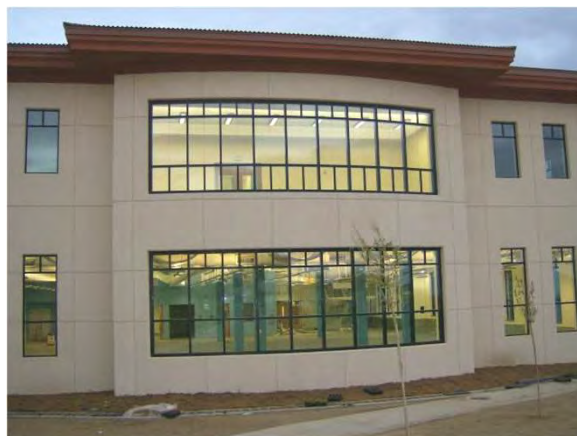
Aspecto do exterior do edifício Outside view of the Fitness Center

Beside the “normal” specialties as water, drain, electrical e communications, was included in our scope of work the supply and installation of a hydraulic elevator, all the systems as: air conditioning, music, commercial intrusion detection system and fire alarm system.