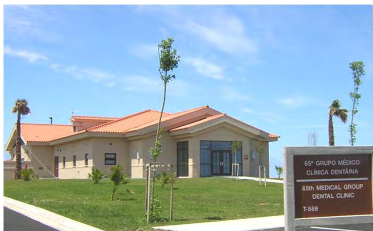
Aspecto do exterior do edifício Outside view of the Dental Clinic

Fez também parte da empreitada o fornecimento e instalação de todo o sistema de ar condicionado, ar comprimido, vacuum, oxigénio, esterilizador, som e detecção de incêndios, bem como todo o mobiliário dos consultórios, laboratório e sala de raio X.