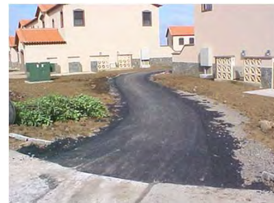
Diversos aspectos da construção. Various images of the new neighborhood.