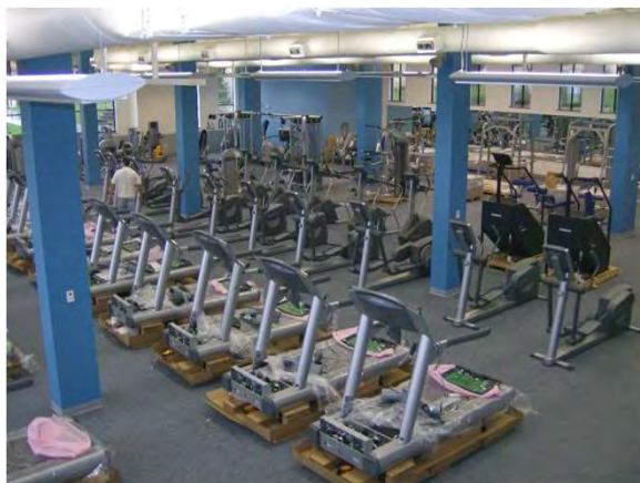
Aspecto do interior do ginásio Inside view of the gymnasium