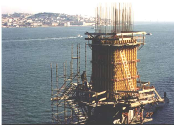
Aspecto da cofragem trepante para a betonagem da torre.

Climbing formwork used for the tower pouring.